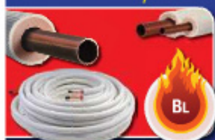
SANGI® SPISM/PM BL