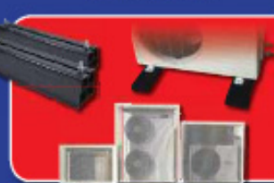
OPSTELLINGSBRAKEN EN VEILIGHEIDSBESCHUTZINGEN