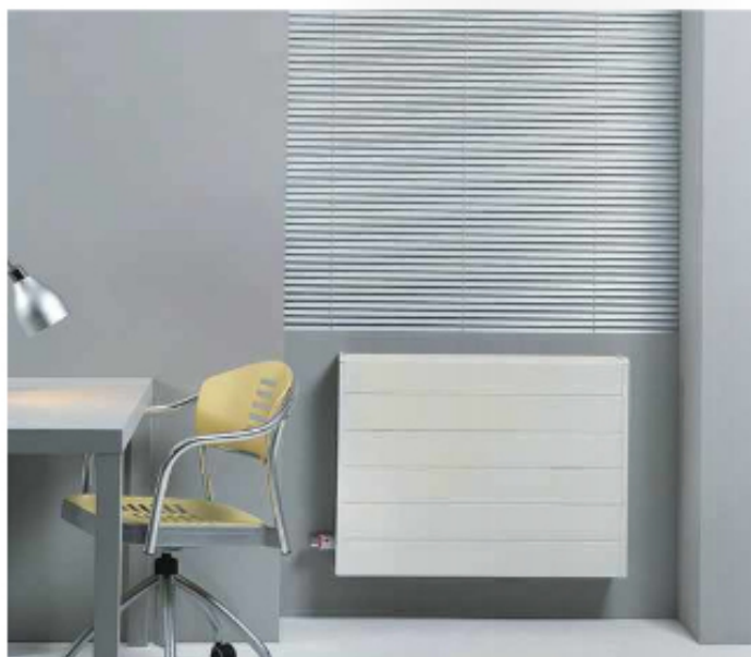
De DBE-units kunnen bijvoorbeeld worden toegepast in de Tempo-radiator.

Low-H 2 O betekent letterlijk 'weinig water'. De 'weinig water'-radiator van Jaga bevat slechts een tiende van de waterinhoud van een traditionele radiator (2 liter in plaats van 20). Een kleinere hoeveelheid water is sneller warm, en de kleinere en lichtere radiator daardoor ook. Een Low-H 2 O-radiator heeft geen zware staalplaten, zoals een traditionele paneelradiator, die eerst zichzelf moet opwarmen voordat hij warmte afgeeft aan de omgeving. Wat de Low-H 2 O wel heeft, is een moderne warmtewisselaar uit aluminium en koper die