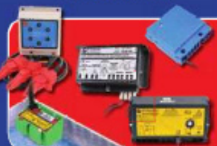
EDC REGELINGEN EN IPC