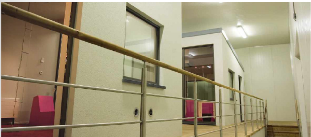
Het experience lab met twee identieke huizen, waarin Jaga de Low-H 2 O-radiatoren in combinatie met een DBE-unit vergeleek met een traditionele paneelradiator.

binnenklimaat, terwijl traditionele radiatoren nog een tijdje onnodig doorstoken of pas te laat weer in actie komen. De Low-H 2 O-radiatoren met DBE-unit zijn daarom ook energiebesparend. In een geconditioneerde laboratoriumsituatie vergeleek Jaga de Low-H 2 O-radiator met een traditionele plaatradiator en kwam tot de uitkomst dat de betere temperatuurregeling en kortere bedrijfsperiodes zorgen voor een energiereductie van dertig procent. <