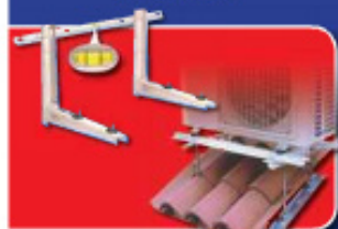
WAND- EN DAKCONSOLES