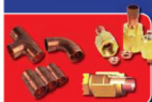
KOPPELINGEN EN FITTINGEN