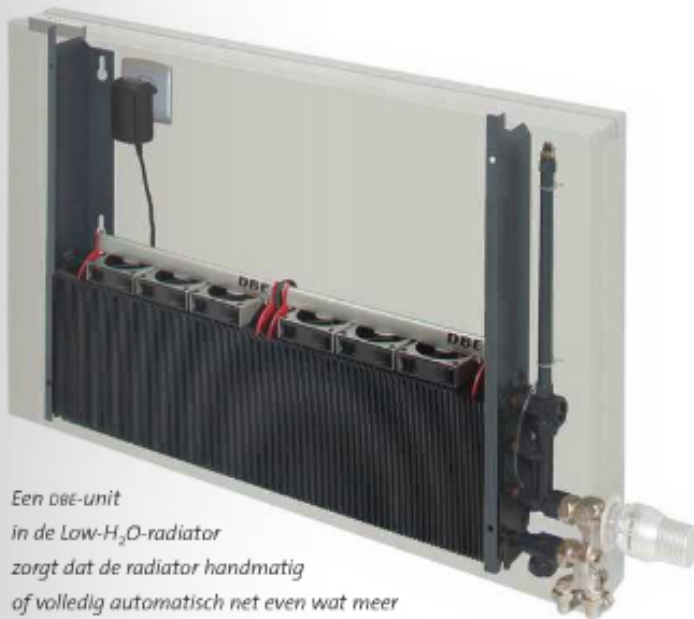
Een DBE-unit in de Low-H 2 O-radiator zorgt dat de radiator handmatig of volledig automatisch net even wat meer warmte afgeeft op momenten dat het nodig is.

de energie (warmte) direct – zonder vertraging – doorgeeft aan de kamer. Dat hogere rendement in de warmtewisselaar wordt behaald door het grotere contactoppervlak tussen koper en aluminium, waardoor de warmteafgifte zelfs bij lage watertemperaturen van 35 °C optimaal is. Door de snelle opwarming zijn de radiatoren ook in staat de temperatuur veel beter te regelen, oftewel snel een ruimte op te warmen. Jaga claimt met deze slimme techniek drie keer zoveel warmte te kunnen genereren als met een gewone radiator van dezelfde afmetingen. Dit dankzij de lage in-